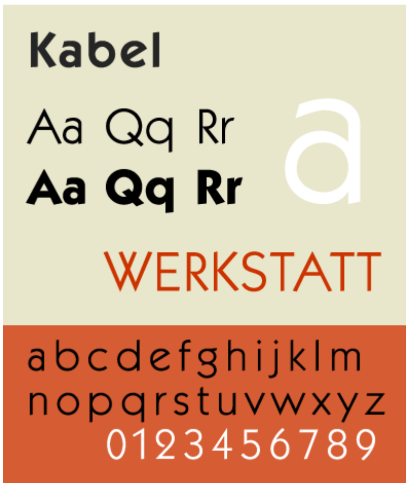
Рис. 18. Гарнитура Kabel