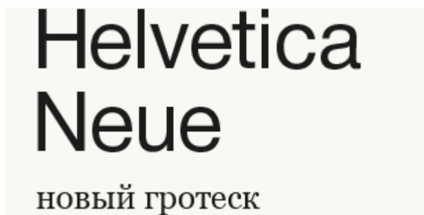
Рис. 15. Гарнитура Helvetica

Ярким примером новых гротесков является Helvetica (см. рис. 15).